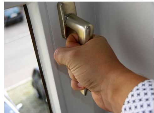
Ein Öffnen der Fenster zum Lüften ist nicht mehr notwendig – aber möglich

Das sonst empfohlene Stoßlüften , was gerade in der kalten Jahreszeit besonders wichtig ist, ist in diesem Fall nicht mehr nötig . Durch den eigenständigen Luftaustausch kann zusätzlich Heizenergie eingespart werden.